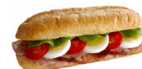
コッパ&ボローニャソーセージ