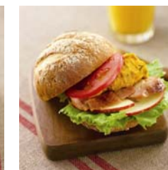
カンパーニュサンド