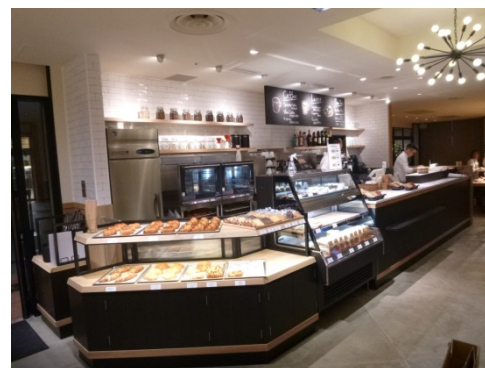
【千駄ヶ谷駅前店のリニューアル事例】